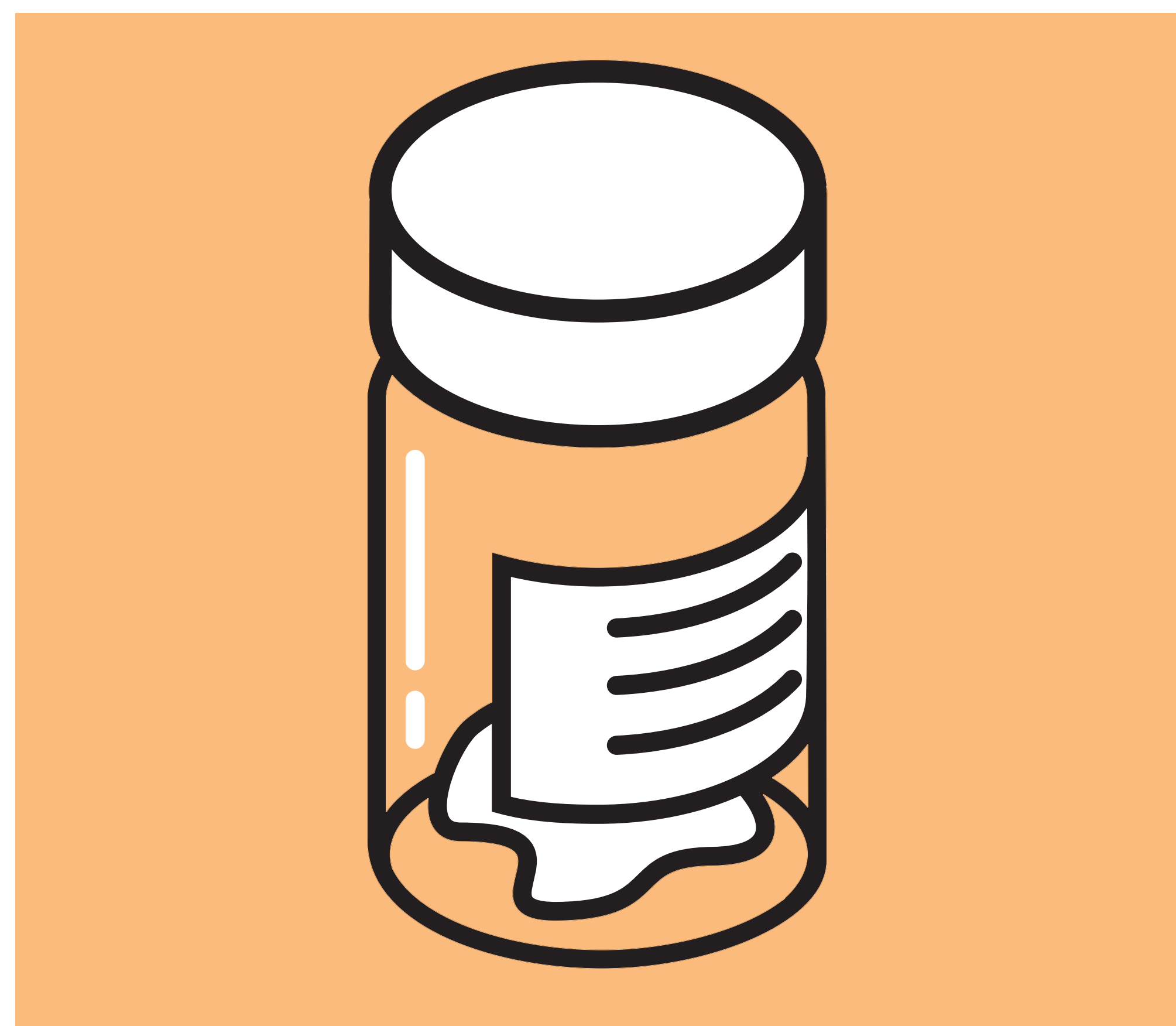
De juiste patiëntenmaterialen