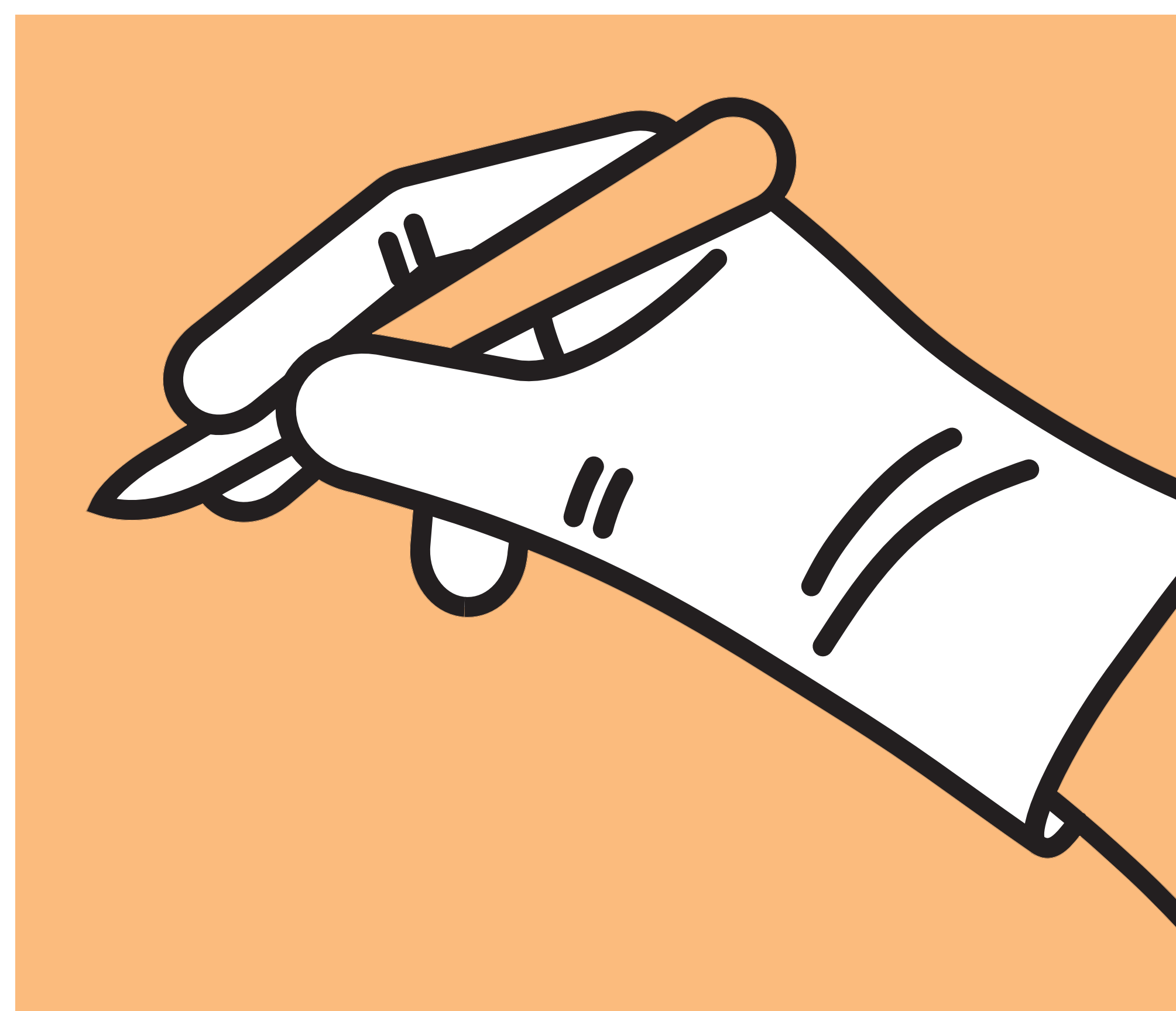
De juiste ingreep